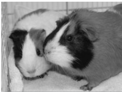
Bo und Heini

Mietzi, der schnuckelige, ca. 9 Jahre alte kastrierte Kater sucht ein Zuhause mit der Möglichkeit zu kleineren Erkundungsausflügen in die Nachbarschaft. Mit seiner verschmusten und freundlichen Art erobert er schnell die Herzen der Menschen. Zwischen den Schmuseeinheiten zeigt er sein geballtes Temperament und freut sich über Spieleinheiten. Auch kommt er mit größeren Kindern und Artgenossen zurecht. Lernen Sie ihn kennen!