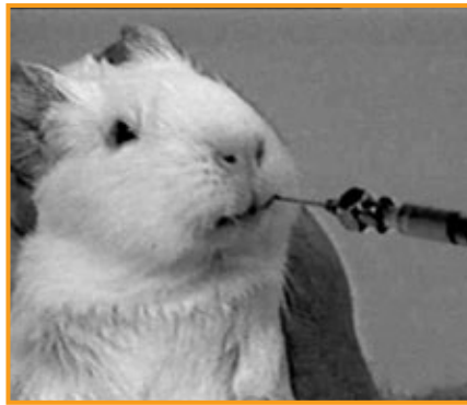
Tiere leiden im Versuchslabor

Im Bereich der Gentechnik zeigt der rasante Anstieg von mehr als 27 Prozent im Vergleich zum Vorjahr, wie exzessiv sich hier mittlerweile der „Tieverbrauch“ gestaltet: über 200.000 Tiere mehr als 2011. Damit sind mittlerweile fast ein Drittel aller verwendeten Tiere gentechnisch manipuliert. Vor allem Mäuse, Ratten und Fische sind hier die Opfer der Wissenschaftler, die wahllos das Erbgut der Tiere verändern. Auch mehr als 160.000 Fische, fast 76.000 Vögel, mehr als 97.000 Kaninchen, 16.310 Schweine, 2.612 Hunde, 1.686 Affen und 863 Katzen mussten für den Forscherhunger und wirtschaftliche Inte-