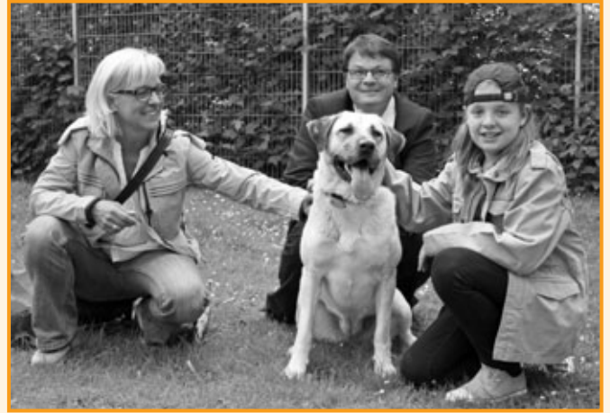
Familie Tombeil übernimmt für Pamuk eine Patenschaft, sie ist noch immer im Tierheim!