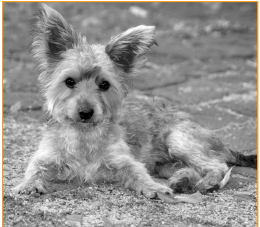
Straßenhunde gibt es in Deutschland nicht wie in Rumänien

Im Gegenteil, sie schaffen nur Platz für neues Tierelend. Die Natur ersetzt die getöteten Hunde und der grausame Kreislauf beginnt von vorne.